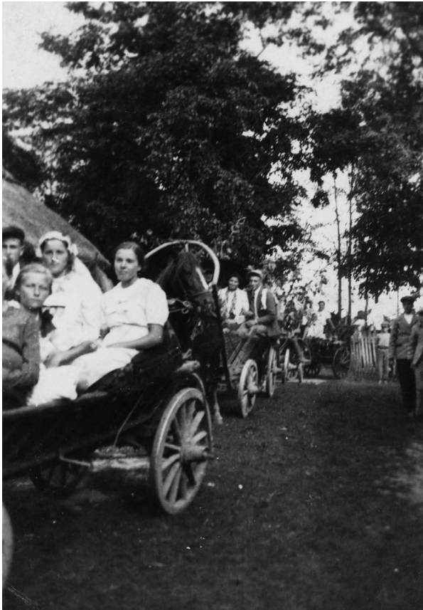
Wesele. Panna młoda jedzie do ślubu w cerkwi w Pasynkach

Hoży družeczki, hoży /2 Jak u sadu róży, Jak u sadu wisznia, Daj Boże zamuż wyszli /2