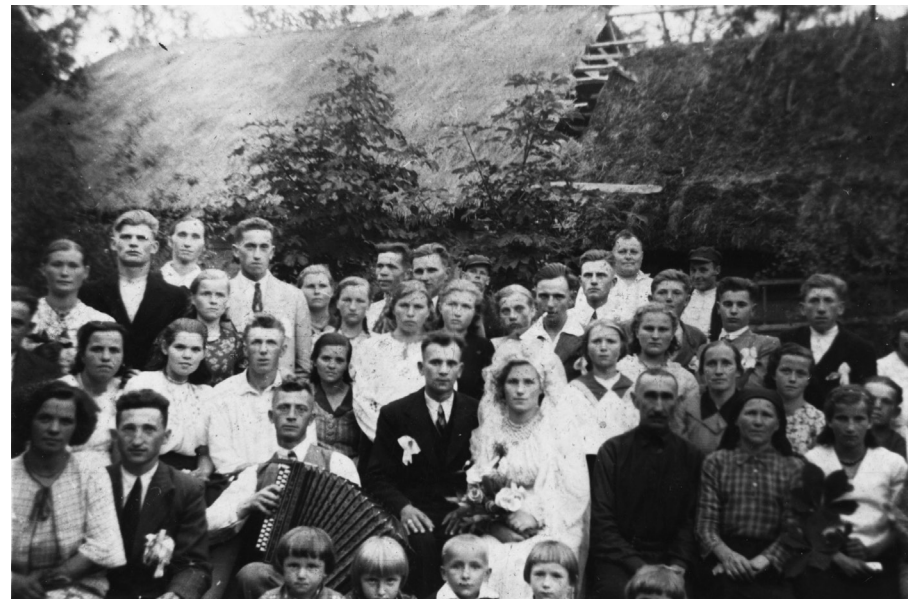
Wesele w Koźynie na święto Piotra i Pawła w czasie II wojny światowej