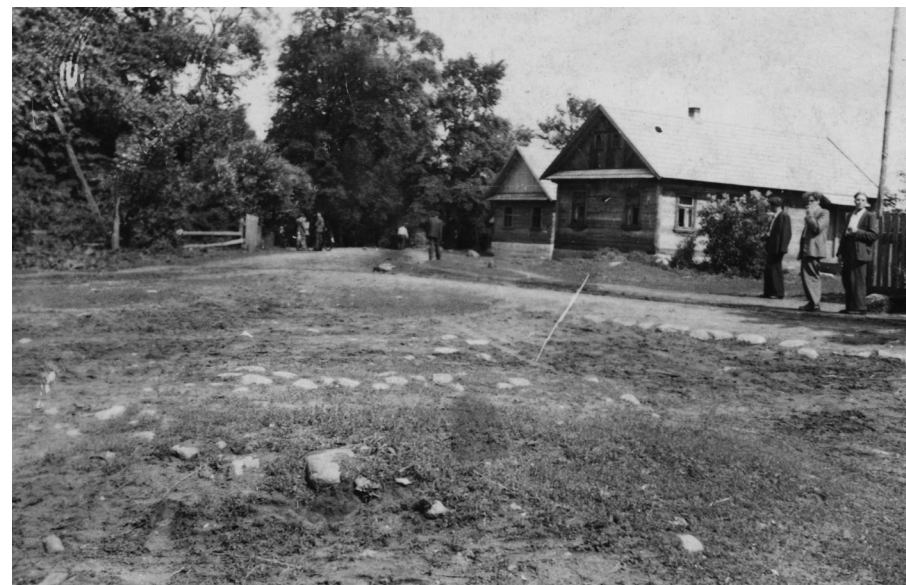
Majowa niedziela w Kozyńie. Lata 50.–60. XX w.