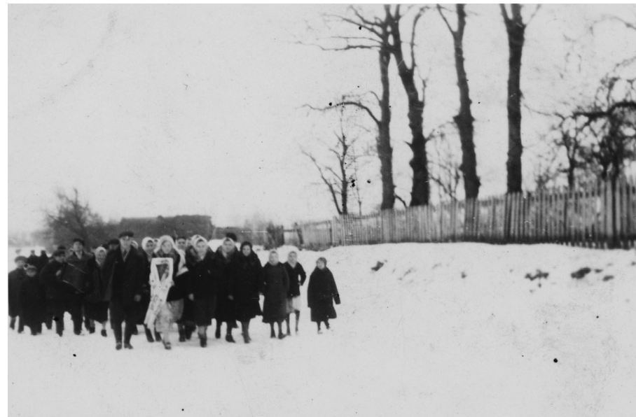
Wesele. Panna młoda i jej goście idą do cerkwi w Klejnikach. Lata 40. XX w.

Steletsia ziele popuod płotom wjuczy Kłaniajsia Nadieczko po zastoliu* jduczy /2 Pokłoniś nizeńko swojomu bateńku Swojomu bateńku do białych nuożok /2 Nechaj kosońka zemlyciu wkryje, Nechaj slozońki nuożki oblijut /2