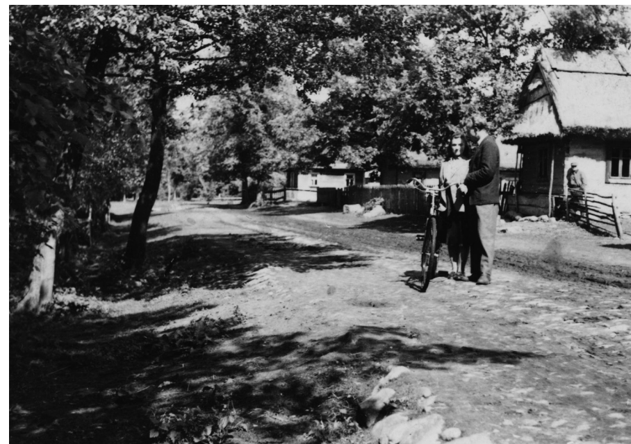
Na kożyńskiej ulicy. Lata 50. XX w.

Ty ne lakajsia szto bosyje nożki stupajut na zimnu rosu ja(ż) tebe rybońko aż do chatynońki / sam na rukach zanesu /2