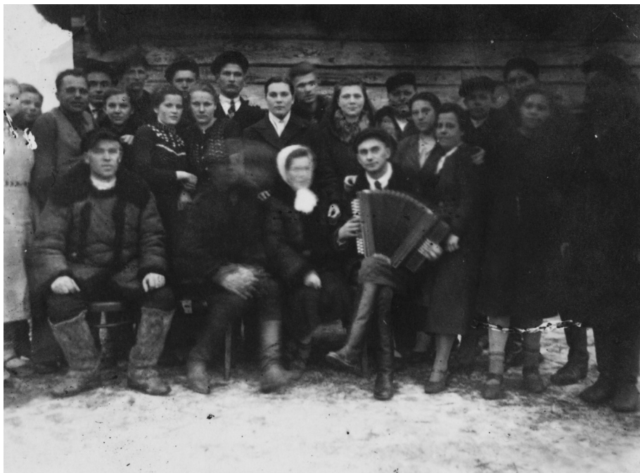
Zapusty. W przerwie potańcówki. Lata 40. XX w.

A szczej kraśniejsza Wanina żena, Po dworye chodit jak miaseć schodyt Do sieni wuojszła jak zora zyjszła So chaty wuojszła paniczye sidiat Paniczye sidiat, szapońki derżat I pytajutsie czyja to żena Iwanko każe to moja żena Moja żuonoczka jak panienoczka